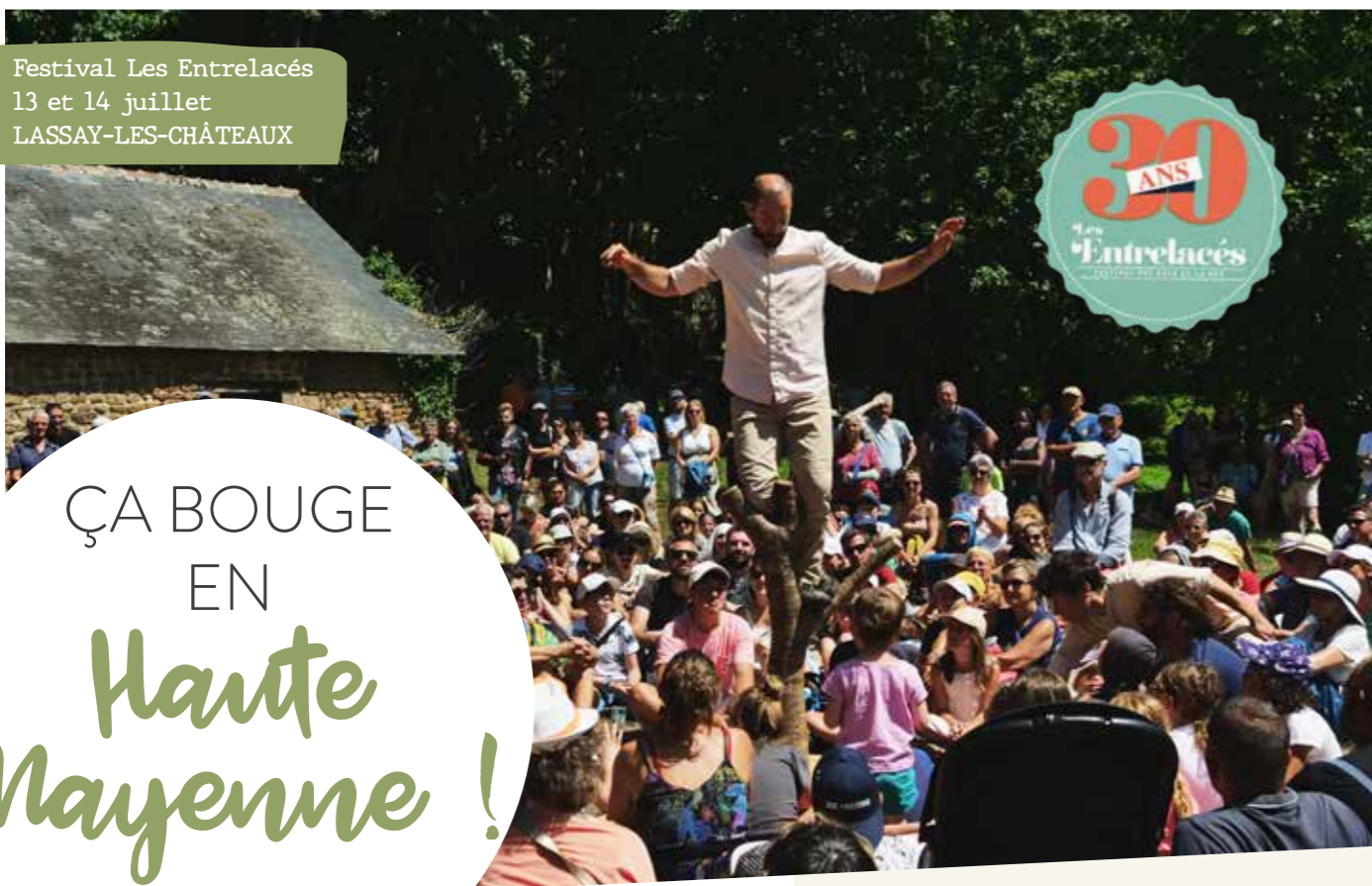
Festival Les Entrelacés 13 et 14 juillet LASSAY-LES-CHÂTEAUX