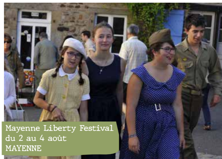
Mayenne Liberty Festival du 2 au 4 août MAYENNE