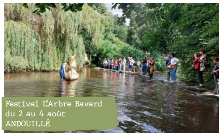
Festival L'Arbre Bavard du 2 au 4 août ANDOUILLÉ