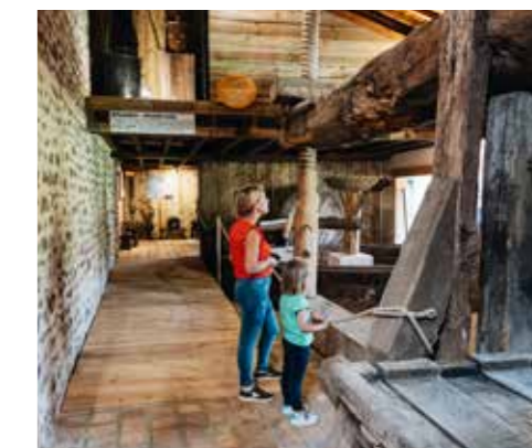
LE MUSÉE DU CIDRE à 7km du centre ville (voir rencontre page 32)

Domaine de la Belle Avette 9 rue de Javron - 53110 Lassay-les-Châteaux 06 63 78 15 47 - 06 78 70 84 89