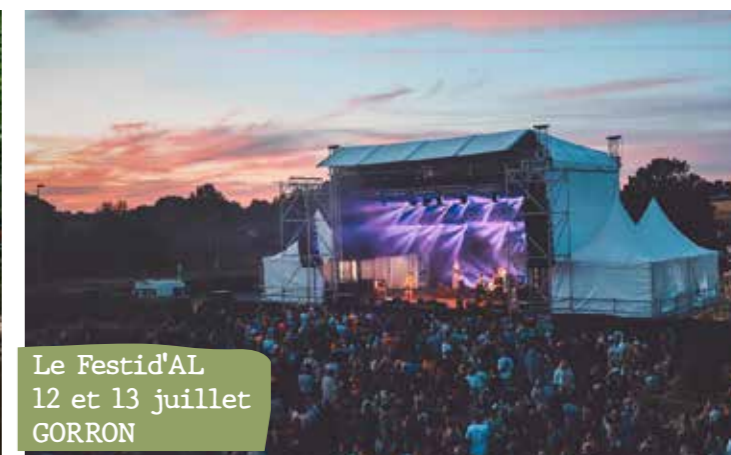
Le Festid'AL 12 et 13 juillet GORRON