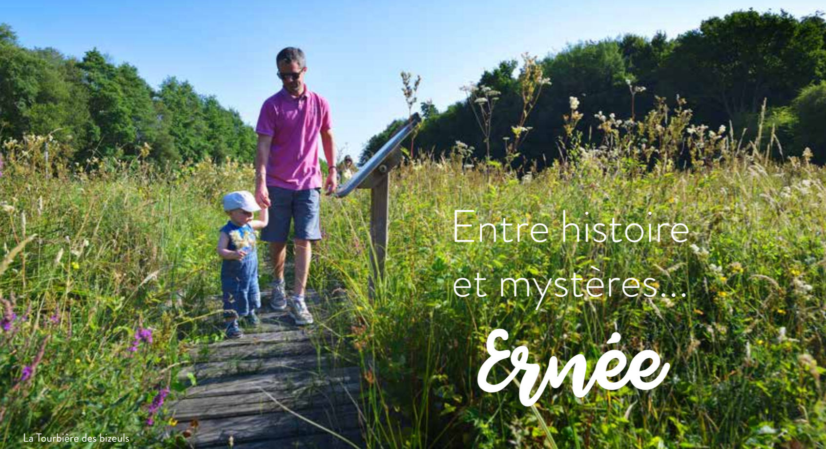
La Tourbière des bizeuls