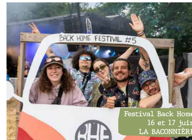
Festival Back Home 16 et 17 juin LA BACONNIÈRE