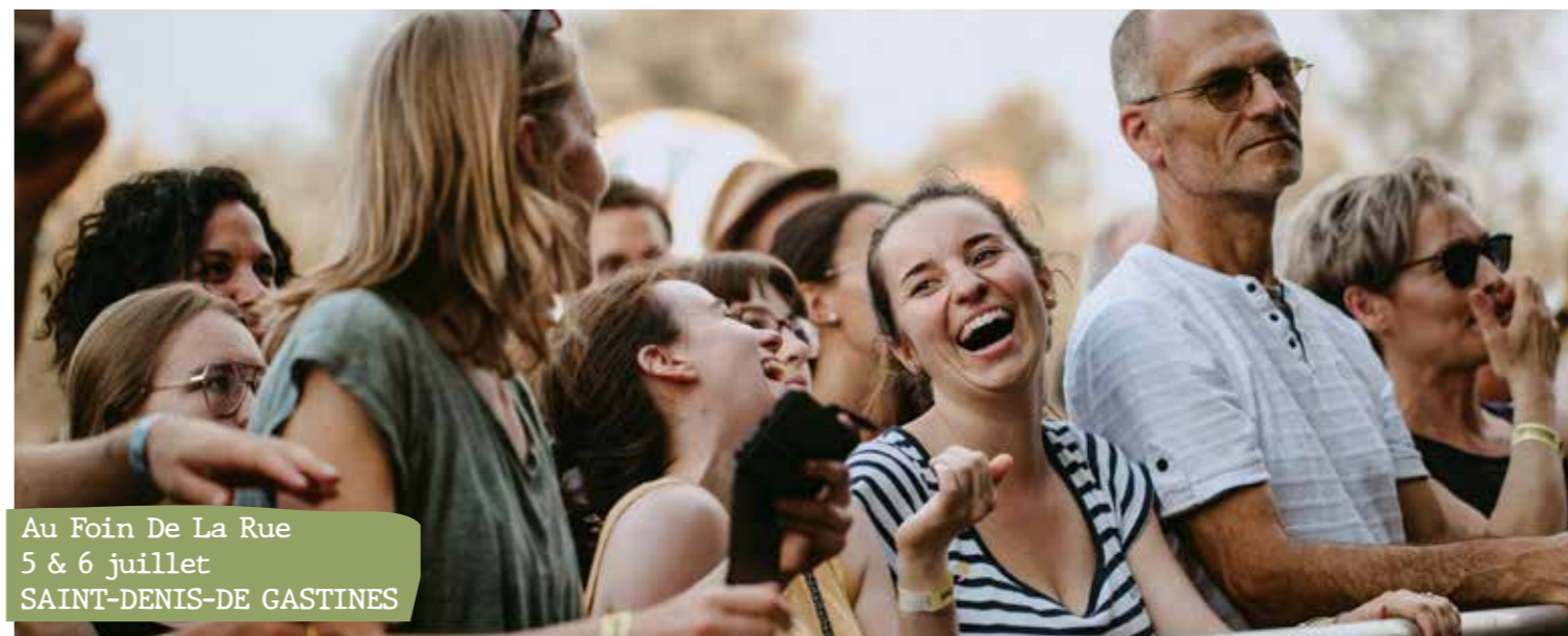
Au Foin De La Rue 5 & 6 juillet SAINT-DENIS-DE GASTINES